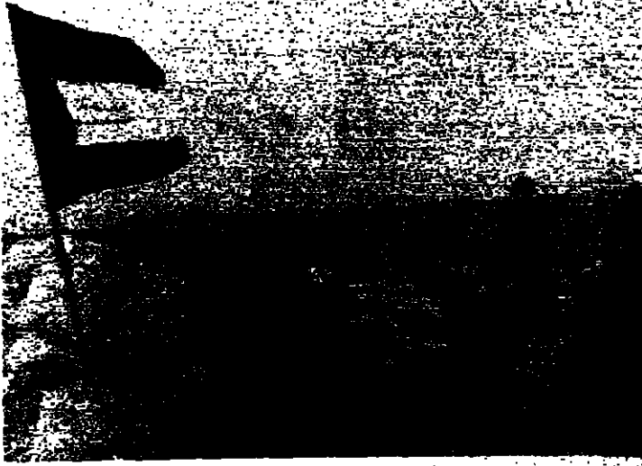
عناصر من «ل.ل.» تتوزع موقعا قرب كبريتي